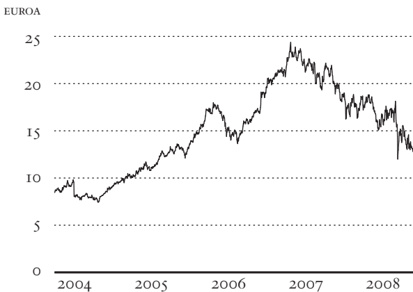
Sammon osakkeen hinta kuukausittain 2004–2008